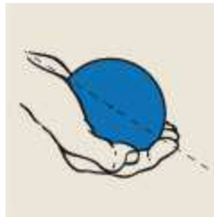
Boule trop grosse « échappe » la boule