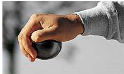
Pouce légèrement plié