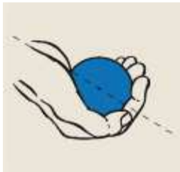
Boule trop petite « crochette » la boule